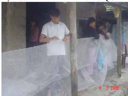
Hình 1. Chuẩn bị vật liệu làm lồng