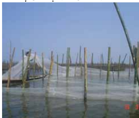
Hình 2. Cắm lồng trên đầm phá