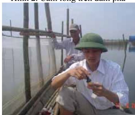
Hình 4. Kiểm tra các yếu tố môi trường